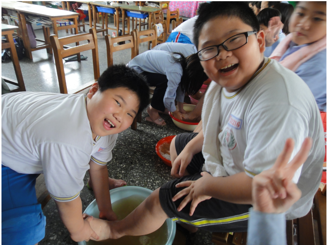
幫同學洗腳，練習後，回家幫爸媽洗腳報恩。