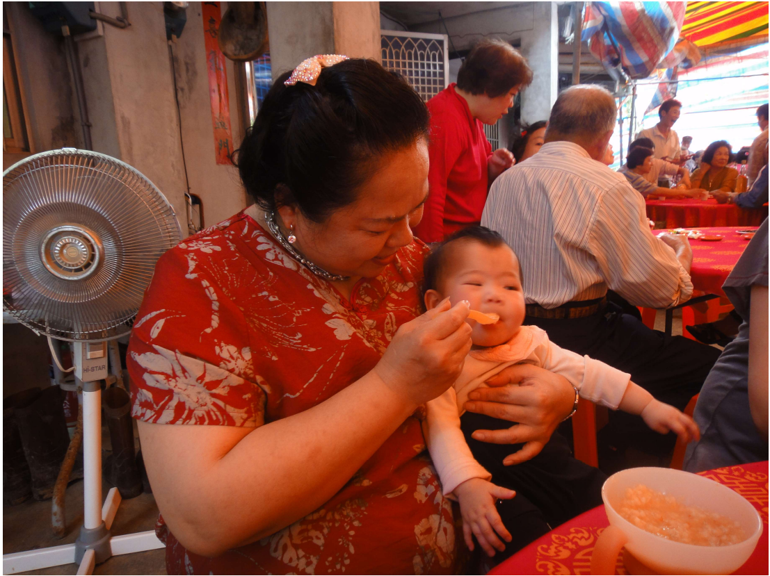
老師與學生分享，小時候就是祖父母或爸媽這樣一點一滴把我們餵養長大。