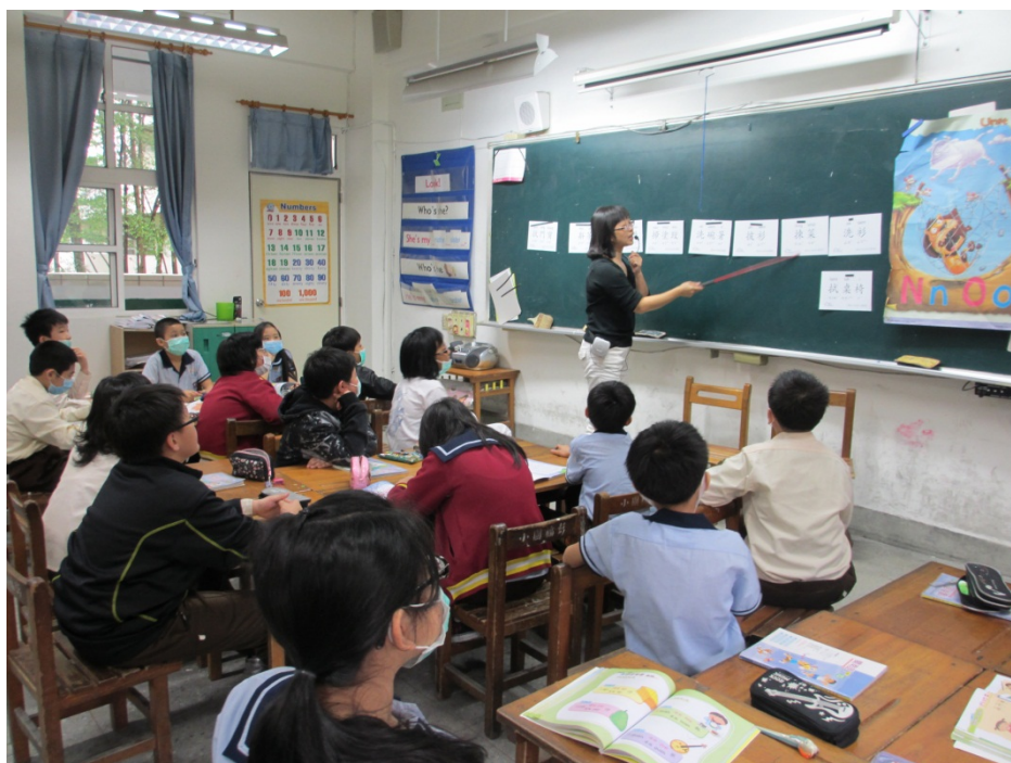
教師說明相關文章並請學生討論。