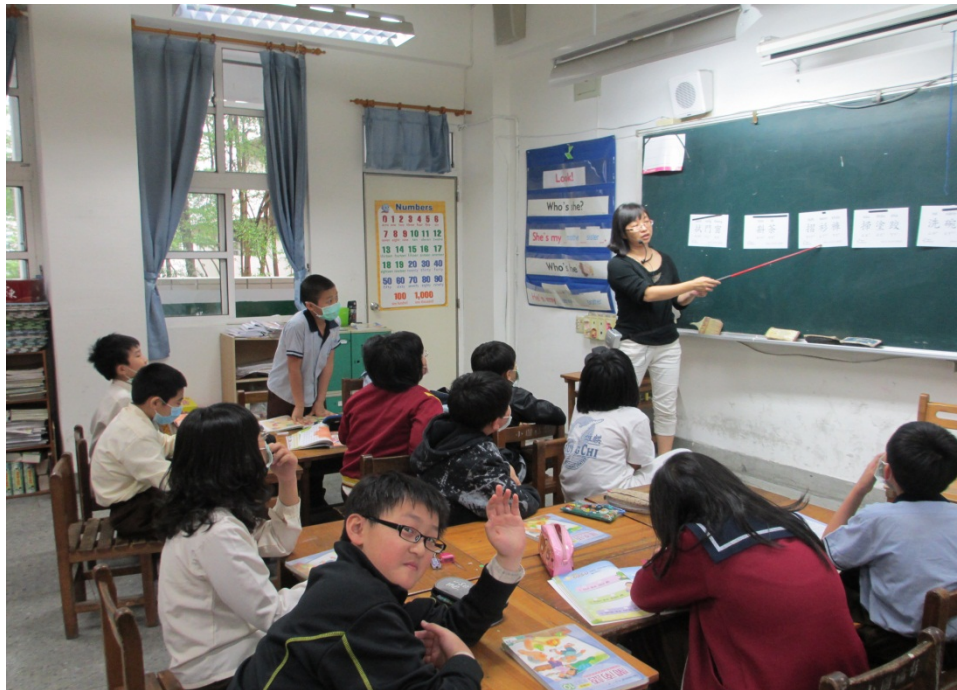
教師教導學生相關閩語用詞。