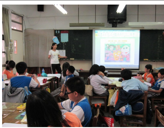
活動三/愛的小語傳真情：滿滿的感動用畫筆和文筆分享出來。