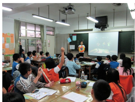
活動一/愛家舞一舞：愛家 515 揭示主題板，討論踴躍。