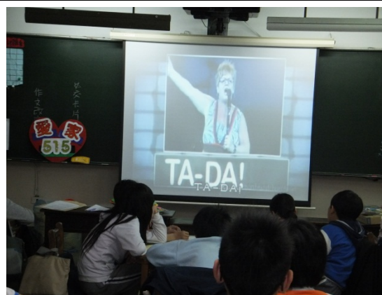
活動二/媽媽之歌：誇張的演唱方式，令人印象深刻。