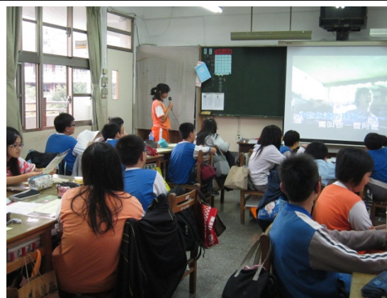
活動三/齊唱阿嬤的話：撼動人心的歌聲，聞者無不深受感動。