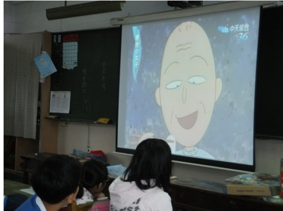
活動一/觀賞影片：櫻桃小丸子的故事寫實逗趣，能引起學生共鳴。