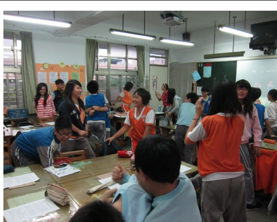
活動二/愛的抱抱：全班練習愛的抱抱，既害羞又開心。