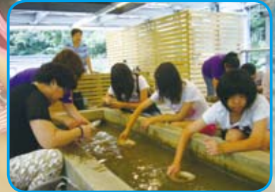
幸福123－九份金瓜石親子遊