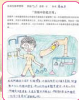
祖孫週－我眼中的祖父母