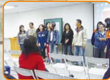
親職講座－如何利用帶動唱來激發孩子