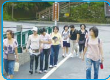
幸福123－九份金瓜石親子遊