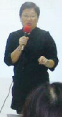
親職講座－家庭資源管理