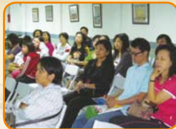
親職講座－從「星」開始－從星座談親子關係