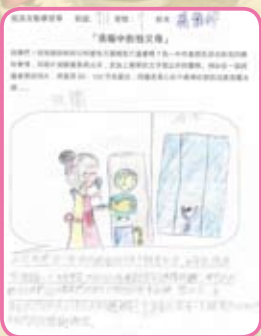
祖孫週－我眼中的祖父母