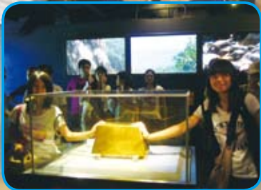
幸福123－九份金瓜石親子遊