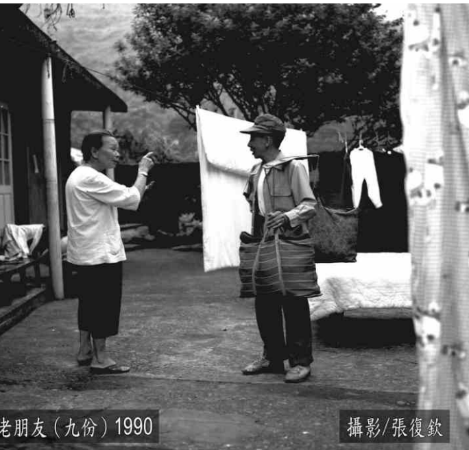
老朋友 (九份) 1990