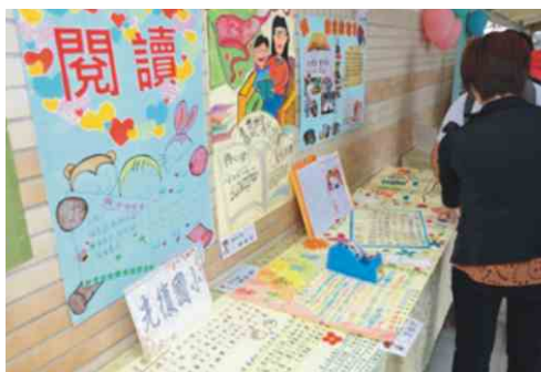
光復國小-家庭閱讀海報優選展覽