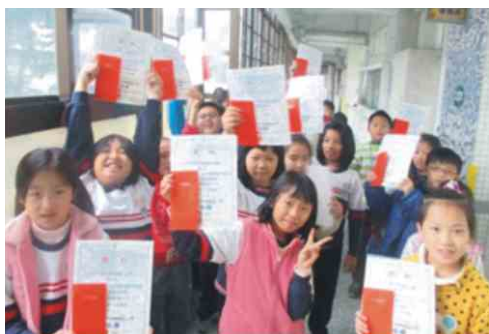
樟樹國小-多元文化繪本親子共讀心得徵選頒獎