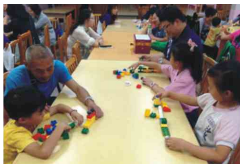
沙崙國小-多感家庭閱讀活動