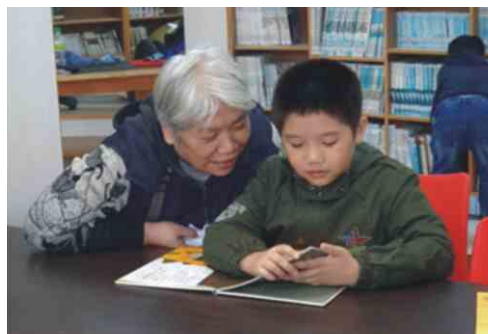
昌隆國小-孫子唸書給阿嬤聽