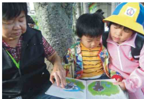
老梅國小-榕樹下祖孫共讀