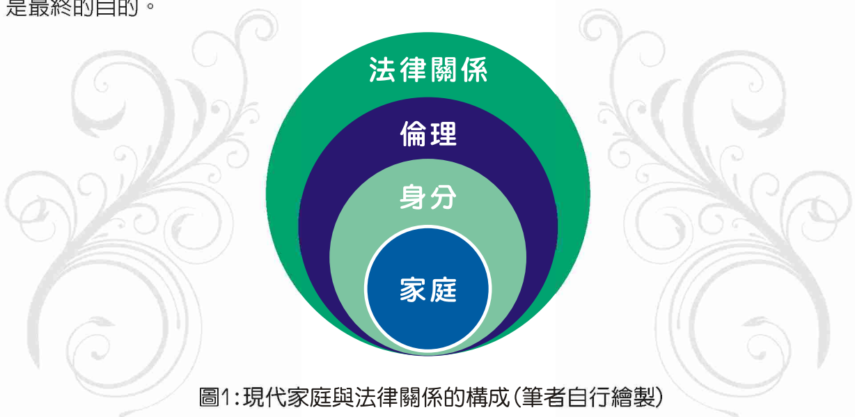
圖1:現代家庭與法律關係的構成(筆者自行繪製)

而如果真的需要法律來介入家庭之時，法院實務上也會以《家事事件法》的妥適、迅速、統合處理家事事件，維護人格尊嚴、保障性別地位平等、謀求未成年子女最佳利益、並讓家庭關係中的弱勢地位者獲得保障，並健全社會共同生活原則來進行相關當事人案件併案審理，更多時候會請案件的當事人靜下來想想家庭生活中的美好以及回憶，如果真的無法繼續共同生活，是否有為彼此的利益選擇最佳協議，祝福家人或家庭成員彼此有更好的未來或許是更好的選項。畢竟從家庭談法律，僅是讓家的美好透過法律的保障更能實現，法律對家庭而言，僅是手段、工具，而非目的，家人互愛美滿的生活才是最終的目的。